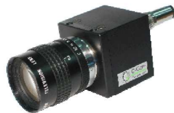
bisheriges Kamerasystem PAMCAM

Dazu sind sowohl Neubeschaffung einer kompletten Kamera, eine Umrüstung der bestehenden Kamera oder die Entwicklung von zusätzlicher Hardware in Betracht zu ziehen und abzuwägen.